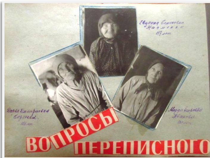
Страница Отчета, посвященная должностителям

Содержание Отчета демонстрирует всю ответственность и креативность, с которой работники на местах относились к своим обязанностям по организации и проведению переписи. Такое отношение к переписной работе было характерно для всей страны. В Отчете представлено много фотографий, рассказывающих о проделанной «политико-массово-разъяснительной работе» среди разных групп населения: на предприятиях, в учреждениях, домах культуры.