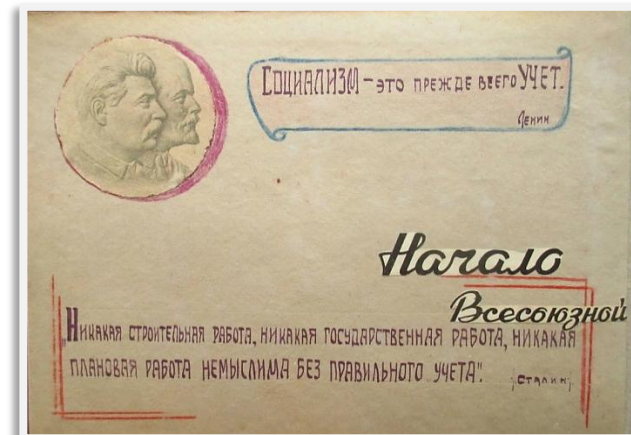
Отчет Прокопьевской городской инспектуры Нархозучета Новосибирской области о проведении Всесоюзной переписи населения

По итогам переписи 1939г. Россия еще оставалась «сельской» страной (доля сельского населения составляла 66,5%). «Городской» она станет по итогам следующей переписи. Кузбасс же был «городским» уже тогда (доля городского населения составляла 55%).