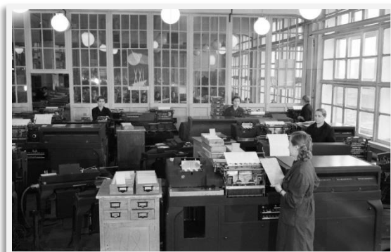
Машинносчетная станция 1959г.

Итоги переписи по Кемеровской области, которая теперь уже имела статус самостоятельного субъекта страны, за двадцатилетний межпереписной период показали рост численности населения с 1,7 млн. человек до 2,8 млн. человек. Доля городского населения увеличилась и достигла 77%. Война принесла с собой не только большие людские потери, но и репрессии, эвакуацию. Эти обстоятельства значительно повлияли на численность и состав населения Кузбасса.